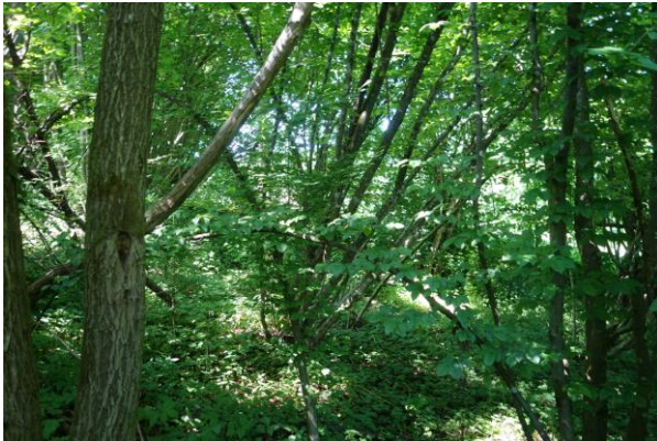
Abbildung 5: Die Baumschicht bildet ein junger Buchenbestand mit Esche und Ahorn als Nebenbaumarten. Die Strauchschicht bilden Hasel, Heckenkirsche und Holunder.