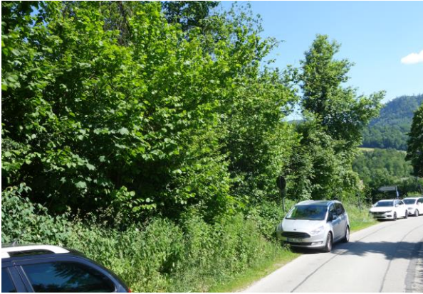
Abbildung 3: Beginn des Geltungsbereichs an der Alten Berchtesgadener Straße.