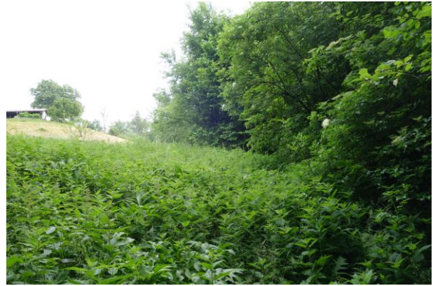
Abbildung 4: Übergang zum Offenland mit dichtem Brennesselbewuchs.