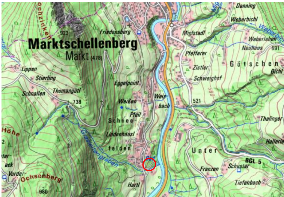
Abbildung 1: Lage des Geltungsbereichs, rot umrandet.

In Abbildung 1 ist die Lage des Vorhabens dargestellt. Der Eingriffsbereich befindet sich im nördlich gelegenen Siedlungsbereich der Gemeinde Tacherting.