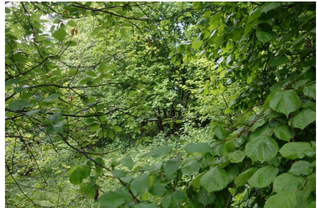
Abbildung 6: .