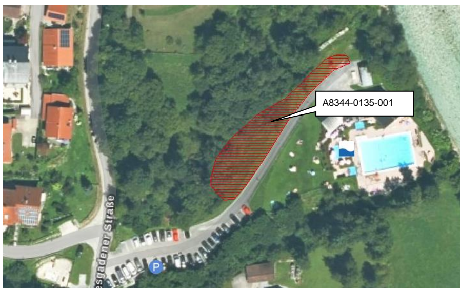
Abbildung 9: Lage der Biotop-Nr. A8344-0135-001, Geltungsbereichs (gelb umrandet).